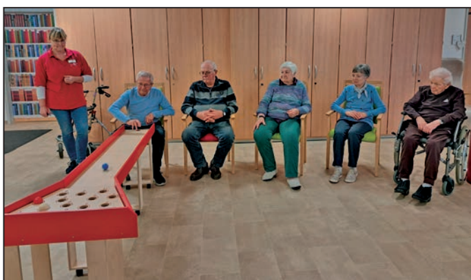
Tischkegelbahn in der BRK-Tagespflege Ochsenfurt.