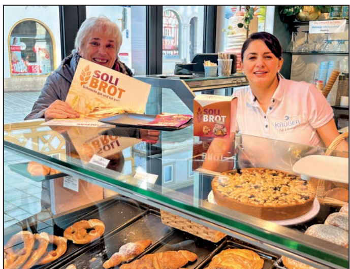
Auch im Café Krüger zu Ochsenfurt stand eine Spendenbox von Misereor unter dem Motto „Backen. Teilen. Gutes tun“ bereit. Text und Bild: Walter Meding

In jedem Jahr engagieren sich Frauen des Katholischen Deutschen Frauenbundes für die jährliche Solibrot-Aktion, initiiert von Misereor unter dem Motto „Backen – Teilen - Gutes tun.“