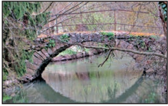
Brücke über die Gollach bei der Lämmermühle

Der Stadtrat genehmigte in seiner jüngsten Sitzung den Antrag der Firma Beuerlein, die den Steinbruch nahe Baldersheim betreibt, auf dem Gelände des Steinbruches eine Freiflächen-Fotovoltaikanlage zu errichten.