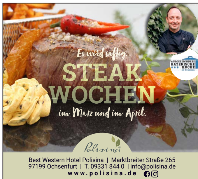
Best Western Hotel Polisina | Marktbreiter Straße 265 97199 Ochsenfurt | T. 09331 844 0 | info@polisina.de www.polisina.de

Für den Benefiztag hatten sich die Veranstalter ein Spendenziel von 15.000 Euro gesetzt. Die endgültige Spendensumme wird im Nachgang der Veranstaltung bekanntgegeben.