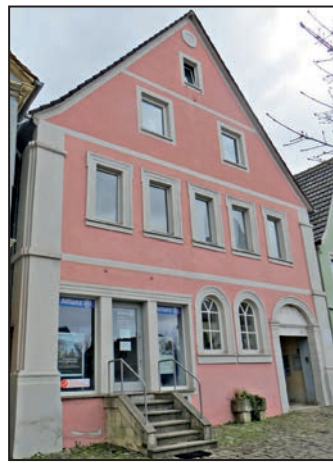
Anwesen Marktplatz 5

In nichtöffentlichen Sitzungen fanden auch erste Gespräche für die Ausschreibung eines neuen Löschfahrzeuges HLF für die Auber Feuerwehr statt. Menth hofft, dass die Ausschreibung noch in diesem Jahr erfolgen kann.