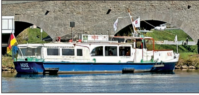
Fertig zum Start in die Saison 2026: Die Ochsenfurter Nixe. Text /Bild: W. Meding