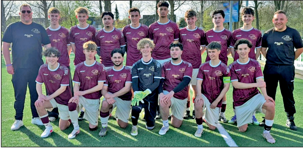
Gemeinsam sind wir stark - U19 der JFG-Maindreieck-Süd 2011 e. V. in Holland, Text: Walter Meding

Über das Osterwochenende nahm die U19 der JFG-Maindreieck-Süd am international besetzten Holland Cup 2026 in Almere/Amsterdam teil. Die Mannschaft reiste bereits am Karfreitag in den frühen Morgenstunden in die Niederlande und nutzte nach der Ankunft die Gelegenheit, Amsterdam bei einer Grachtenfahrt näher kennenzulernen.