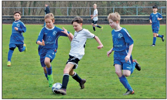
Viel Freude hatten die Kicker des OFV am Heimspieltag der Juniorenabteilung