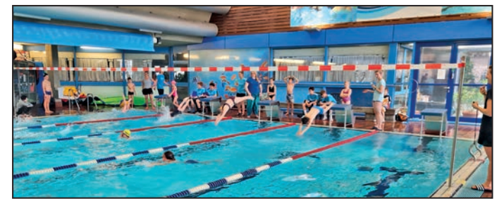
Das 56. Kreisschwimmfest fand im Mainlandbad Höchberg statt. Die Schülerinnen und Schüler traten unter anderem beim fünfminütigen Mannschaftsdauerschwimmen gegeneinander an. Textbearbeitung: W. Meding; Bild: A. Sandwegner

Auch in diesem Frühjahr fand im Landkreis Würzburg wieder ein sportliches Highlight statt: Bereits zum 56. Mal traten Schülerinnen und Schüler verschiedener Altersklassen beim Kreisschwimmfest an. Insgesamt 13 Schulen nahmen teil. Austragungsort war das Mainlandbad in Höchberg, wo rund 190 Schwimmerinnen und Schwimmer in verschiedenen Staffeldisziplinen ihr Können zeigten.